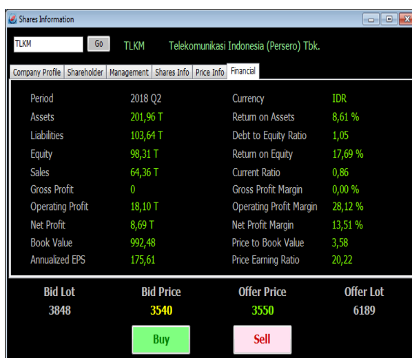
Gambar 2. Fundamental analisis salah satu saham.