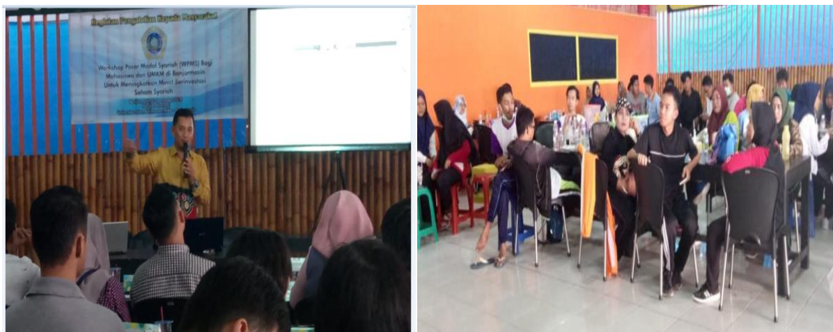
Gambar 3. Penyampaian materi, ceramah dan diskusi