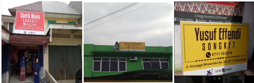
Gambar 5. Papan Nama Usaha

tempat pemilik usaha serta dapat meningkatkan penjualan.