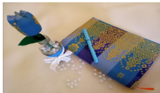
Gambar 1. Diversifikasi produk berupa cover agenda dan hiasan bunga tulip