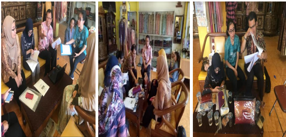
Gambar 4. Foto Kegiatan Pelatihan Strategi Promosi Melalui Media Sosial dan Social Marketplace

Papan Nama Usaha . merupakan sebuah media informasi yang berisi nama perusahaan. Manfaat papan nama sebagai media komunikasi bisnis menjadi faktor penting kesuksesan menginformasikan brand perusahaan. Papan nama usaha bisa berfungsi sebagai media jalan pintas untuk mengundang pengunjung untuk membeli dan memakai produk yang ditawarkan atau dijual. Saat ini