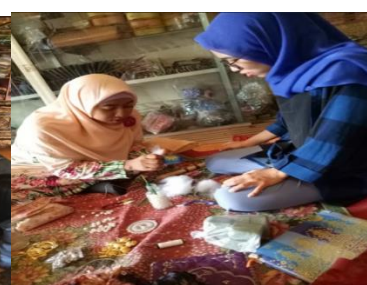
Gambar 2. Foto Kegiatan Pelatihan Membuat Cover agenda & Hiasan Bunga Tulip

Dari pelatihan di atas telah menumbuhkan ide kreativitas dan inovasi responden untuk membuat aneka macam kerajinan souvenir lainnya. Berikut tabel kapasitas produksi dan jenis kerajinan