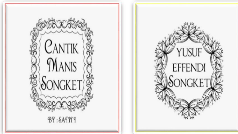
Gambar 2. Merek dan Logo Kerajinan Souvenir

Logo merek souvenir akan disablon pada kantong plastik kemasan. Logo merek sengaja tidak dibuat banyak ornamen dengan pertimbangan kerajinan songket adalah kerajinan khas Palembang yang terkesan elegan, sehingga logo yang dibuatpun harus terkesan elegan.