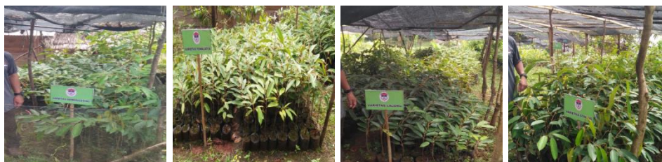
Gambar 4. Varietas dDurian yang tersedia di Unit Usaha PPUPIK Fakultas Pertanian Unanda Palopo

Pemasaran bibit durian unggul lokal Palopo tidak ditemukan kendala, karena didukung oleh promosi. Hal ini dikarenakan pembeli biasanya datang sendiri ke petani atau meminta bantuan kepada Dinas Pertanian untuk mencarikan penangkar bibit tanaman buah. Pemasaran bibit tanaman buah dilakukan melalui dua cara, yaitu penjualan secara langsung ke konsumen (perorangan) dan penjualan melalui pedagang (perantara, pengecer). Penjualan sebagian besar melalui pedagang (perantara, pengecer) dan hanya sebagian kecil saja yang dijual secara langsung ke konsumen. Penjualan secara langsung ke konsumen dilakukan penangkar dari showroom . Sistem pembayaran dilakukan secara kontan atau cicilan tergantung dari kesepakatan. Namun umumnya penangkar menggunakan sistem pembayaran tunai.