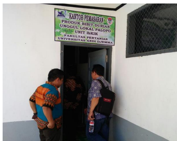
Gambar 3. Lokasi Produksi dan Kantor Pemasaran Bibit Durian Unggul Lokal Palopo