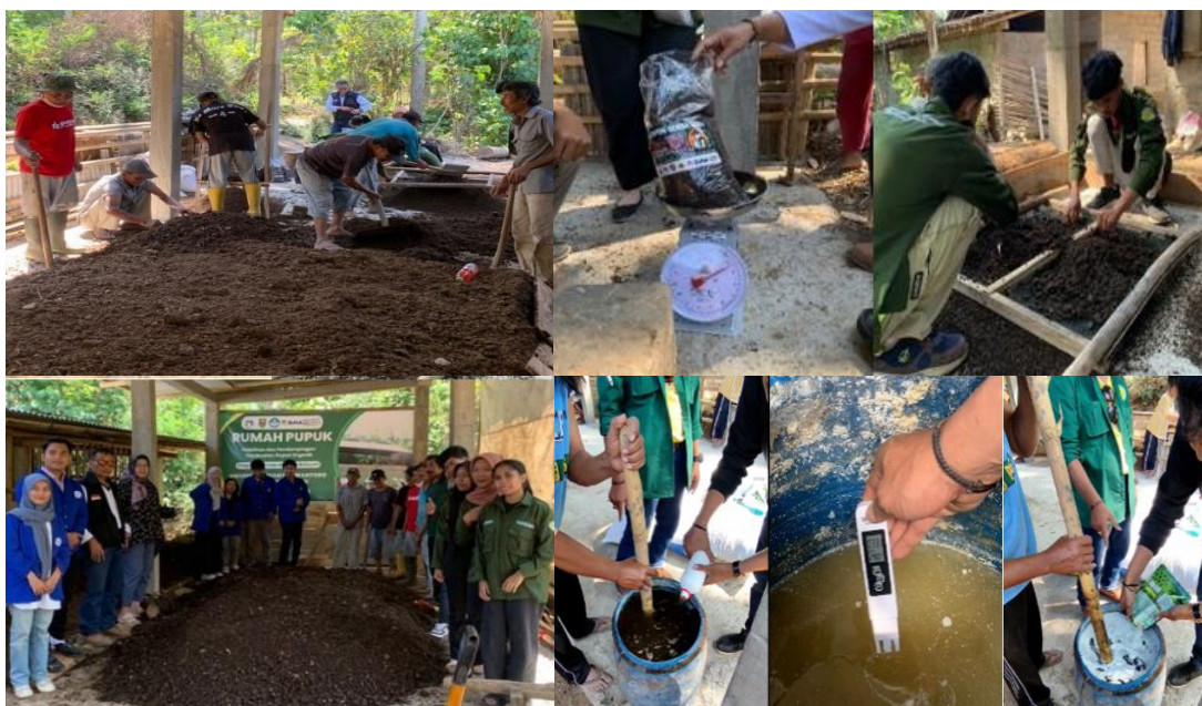
Gambar 1. Kegiatan pelatihan pembuatan pupuk dari kohe

Triangulasi sumber: data berasal dari observasi, wawancara, dan dokumen monitoring, konfirmasi mitra (member checking), ketua kelompok tani memvalidasi hasil observasi & evaluasi, triangulasi metombinasi tes, observasi, dokumentasi, dan diskusi, pencatatan sistematis seluruh data dicatat dalam logbook pendampingan selama 14 hari.