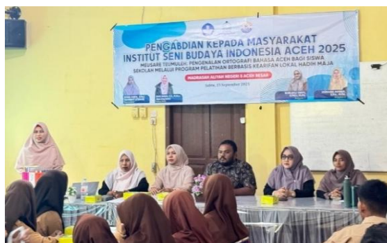
Gambar 1. Tim Memberikan Materi dalam Pelatihan Ortografi bahasa Aceh

kesulitan dalam menerapkan aturan penulisan vokal tertentu. Kesalahan paling umum ditemukan pada penggunaan huruf vokal berdiakritik seperti ö, ô, è, dan é. Misalnya, pada kata beulangöng , tidak ada satu pun siswa yang menuliskannya secara tepat; sebagian besar menulis beulangong atau beulangoeng . Hal serupa terjadi pada kata jeuèe , yang hampir seluruhnya ditulis terpisah menjadi jeu e , serta pada kata tagarô yang ditulis tagaro atau tagaroe . Temuan ini menunjukkan bahwa pengetahuan siswa mengenai penggunaan huruf vokal berdiakritik dalam ortografi Bahasa Aceh masih sangat terbatas. Oleh karena itu, pelatihan yang diberikan menjadi relevan dan mendesak untuk memperkuat kompetensi literasi tulis Bahasa Aceh di kalangan siswa MAN 5 Aceh Besar.