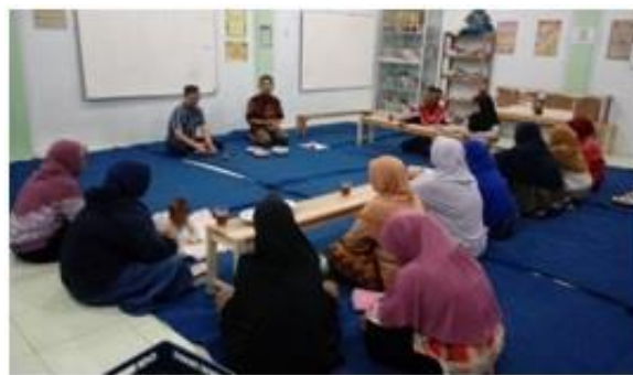
Gambar 2 Pendampingan Tertib administrasi

Hasil dari program kemitraan ini berupa kegiatan pendampingan pengelolaan administrasi yang meliputi: (1) Pendampingan pemanfaatan komputer untuk kegiatan administrasi; (2) Pendampingan administrasi dan keuangan syariah. Kegiatan pelatihan komputer dilaksanakan tanggal 18 dan 28 Agustus 2019 dengan materi Microsoft word dan microsoft office. Setiap materi diberikan selama 2 jam yang berupa teori dan praktek. Sesi praktek lebih mengedepankan skill dan kemampuan. (Ikhwani, Budiman, & Rasyidan, 2015) Foto kegiatan pelatihan komputer terlihat pada gambar 1 berikut :