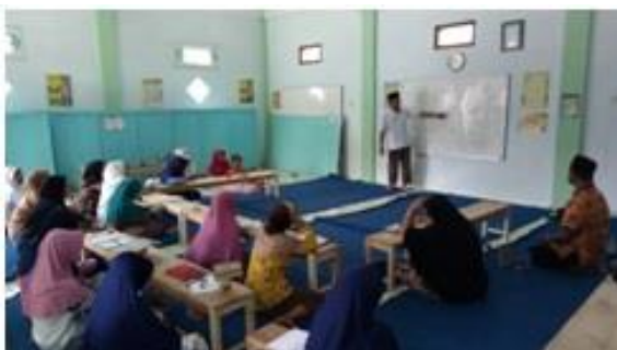
Gambar 3. Workshop Sistem Keuangan Syariah

Kegiatan berikutnya adalah workshop sistem keuangan syariah dengan pemberian materi dan praktek sistem keuangan syariah yang dilaksanakan pada hari Ahad, tanggal 29 September 2019. Kegiatan ini dimulai Jam 09.00 sampai jam 15.00 bertempat di TPQ Al Muttaqien dusun Turen. Kegiatan tersebut terlihat pada Gambar 3. berikut :