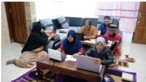
Gambar 1 Pelatihan Pengoperasin Komputer.

Sasaran program kemitraan ini adalah pengurus Kelembagaan di Dusun Turen, yang terdiri dari pengurus-pengurus Kelompok Tani, Lembaga Keuangan Mikro / Koperasi, PKK dan Dasa Wisma. Lokasi kegiatan berada di Dusun Turen Desa Kradenan Kecamatan Srumbung Kabupaten Magelang Provinsi Jawa Tengah.